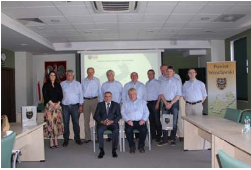
Die Delegation des Heimatvereins Alstätte mit Vertretern der Kreisverwaltung

Zum Abschluss der Reise stellte sich die „Deutsch Sozial-Kulturelle Gesellschaft“ in Breslau vor. Das Hauptziel der Gesellschaft ist die Pflege und Bewahrung des kulturellen Erbes der Region und die Förderung der deutschen Minderheit.