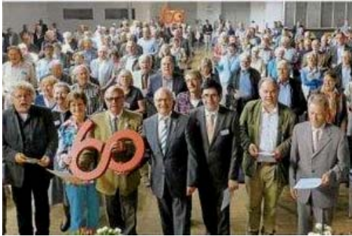
Mit einer roten „60“ gratulierte der Westfälische Heimatbund dem Landschaftsverband zum Jubiläum.