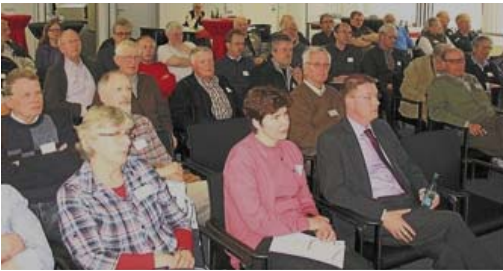
Rund 70 Interessierte besuchten die Tagung der Familienforscher in Borken.

diese Tagung organisiert hatte, gab es für die fast 70 anwesenden Mitglieder und auch Neueinsteiger Informationen aus der Familienforschung. Erfreulich, heißt es in der Pressemitteilung, sei die positive Entwicklung der Arbeitsgemeinschaft auf 231 Personen. Die weiter gestiegene Anzahl der archivierten Findbucheinträge, Totenzettel- und Familienanzeigen wurden gelobt.