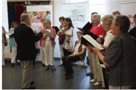
Der Kirchenchor St. Walburga bereicherte das Programm des Kreisheimattages musikalisch.