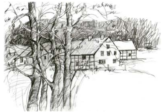
Ostwestfälischer Hof im Tal Bleistift auf Papier 31 x 42 cm

Insbesondere der ältere Leser erlebt das ländliche und bäuerliche Leben auf dem Lande intensiv mit „Ja,